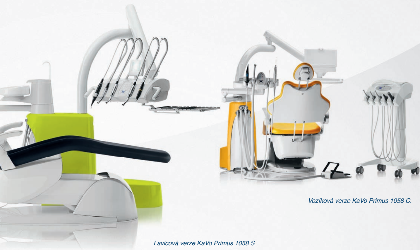
Lavicová verze KaVo Primus 1058 S.

Užijte si i ve verzi vozík intuitivní vedení ovládním, využijte doplňkovou mobilitu vašeho lékařského prvku a, pokud budete potřebovat, postavte jej stranou.