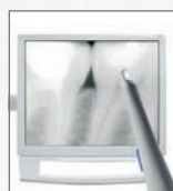
ERGOcom light + ERGOcam