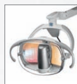
Vyšetřovací osvětlení EDI