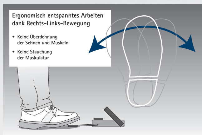
Nožní spouštěč umožňuje zdravé a přirozené postavení nohou.