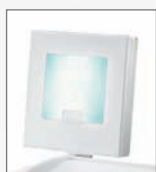
Prohlížeč malého rentgenového snímku