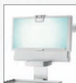
Prohlížeč panoramatického rentgenového snímku