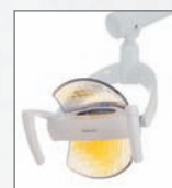
Vyšetřovací osvětlení KAVOLUX 1410