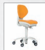
Pracovní židle PHYSIO 5007